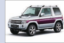
三菱自動車工業 パジェロミニ 芝生広場