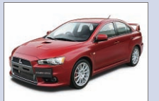
三菱自動車工業 ランサーエボリューションX アトリウム