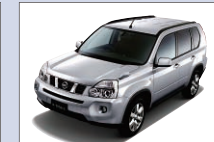
日産自動車 エクストレイル クリーンディーゼル 芝生広場