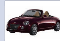
ダイハツ工業 コベン 芝生広場