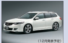
本田技研工業 アコードツアラー 芝生広場