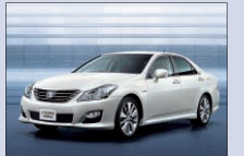
トヨタ自動車 クラウン ハイブリッド 芝生広場