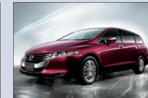
本田技研工業 オデッセイ 入口広場