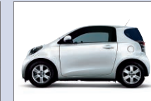
トヨタ自動車 iQ キャンピースクエア