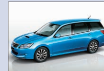
富士重工業 エクシーガ 芝生広場