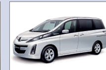
マツダ ピアンテ 芝生広場