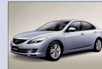
マツダ アテンザ セダン 入口広場