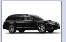
富士重工業 レガシィ アウトバック 入口広場