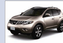
日産自動車 ムラーノ アトリウム