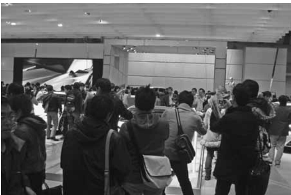
第43回東京モーターショー 2013

この高度運転支援システムの開発において、各社が力を注いでいるのが自動運転技術に関するものといえる。世界に誇るクルマの技術、IT・エレクトロニクス技術が融合することで成し遂げら