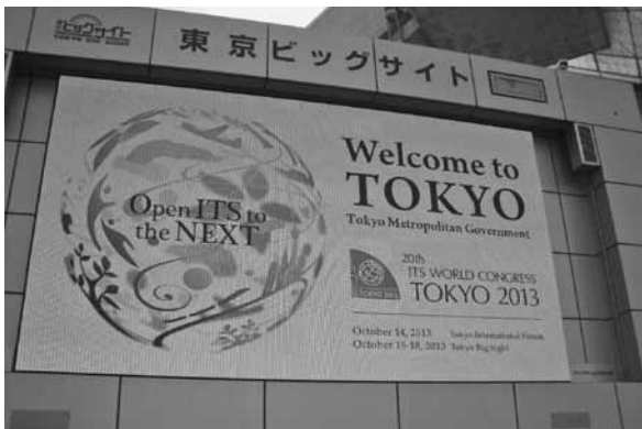
第20回ITS世界会議 東京 2013

この東京会議で注目を集めたテーマは、高度運転支援システム、自動運転、ITSビッグデータ。会議セッションは、専門家による国際会議だけではなく、市民参加の国際会議も開催され、熱い議論が交わされた。そして、着々と準備やテストが進んでいるインフラシステムを来場者が体験できる