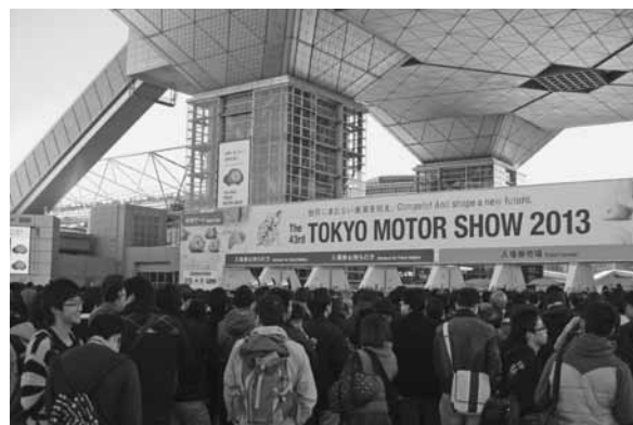
第43回東京モーターショー 2013

会場内には、今回のテーマに挙げられた「未来を競え」を具現化した場も設けられた。それが、近未来のモビリティ社会の姿を体感してもらうための「SMART MOBILITY CITY 2013」だ。「KURUMA NETWORKING…くらしに、社会に、つながるクルマたち」をテーマに、それをわかりやすく紹介した展示とともに具現化する最先端の製品や技術などを民間企業・関係諸団体が先進技術・製品のプレゼンテーションを行ったエキシビション、国内外の次世代自動車の試乗やITSを体験できるテストライド、国内外の専門家・企業経営者・技術者などが最先端の技術開発動向や具体的な導入事例を紹介したカンファレンスの3つで構成されていた。その中でも注目を集めていたのが、国内外の次世代モビリティの魅力を実験できるテストライドコーナーで、パーソナルモビリティや超小型モビリティの体験走行や高度運転支援システムのデモンストレーションを多くの来場者が体感。前方車両のナンバーを認識して自動的に追跡する追従走行、自動駐車など、クルマの新たな魅力に触れることで、近未来のモビリティ社会を身近に感じ取っていた。