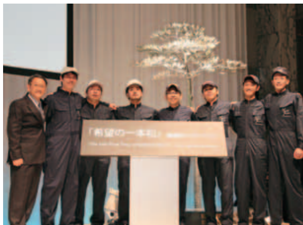
*東日本大震災のとき7万本の中でたった1本だけ生き残った陸前高田市の「奇跡の一本松」。そのレプリカを各社の若手技術者たちが銅板で再現した。

ですね。クルマが情報通信やエネルギーなど、社会システムとネットワークの重要な役割を持つことで、くらしの“安心・安全”や“利便性・快適性”を充実させる様子を見ていただきました。