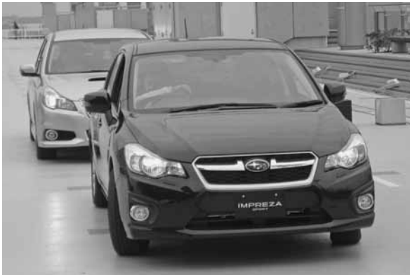
第43回東京モーターショー 2013