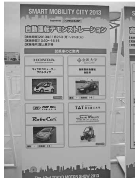
第43回東京モーターショー 2013

れる最先端技術であり、車両間における通信技術を利用してさまざまな応用、発展をみせているといえる。もちろん、そこにはカメラや制御ソフトなどが高度に組み合わせることで、車間距離を自動的に制御する、走行ラインを自動算出して自律走行するクルマなども含まれる。