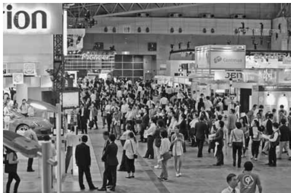
CEATEC JAPAN 2013

2013年10月1～5日まで幕張メッセで開催されたCEATEC (Combined Exhibition of Advanced Technologies) JAPAN 2013。最先端IT・エレクトロニクス総合展として14回目を迎えた今回のテーマは、「Smart Innovation - 明日の暮らしと社会を創る技術力」。IT・エレクトロニクス技術の