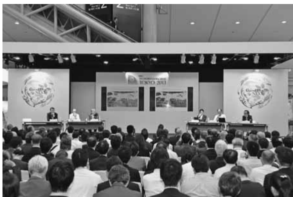
第20回ITS世界会議 東京 2013