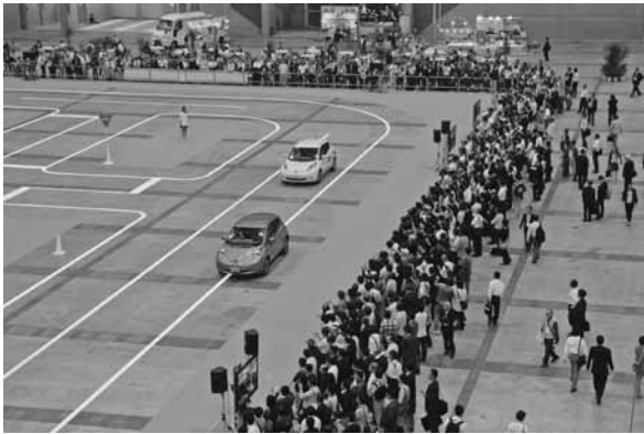
CEATEC JAPAN 2013

は使用されている。もちろん、普及が進むハイブリッドカーや電気自動車などにおいて電子工学分野は欠かせない技術領域となっており、電子装置の進化がなければ実現できなかった機能も多々あるといえる。発展を遂げたのは、クルマ本体や制御関係だけでなく、車内のインテリア関係の各パーツにも表れている。例えば、電子メーターもIT・エレクトロニクスとの融合で生まれたものであり、ドライバーを目的地まで安全・快適に導いてくれるカーナビゲーションも例外ではない。