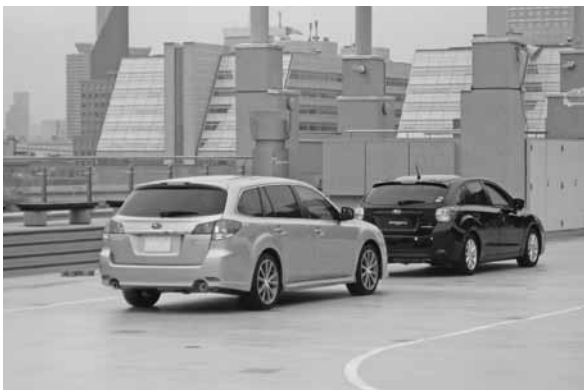
第43回東京モーターショー 2013