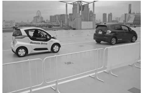
第43回東京モーターショー 2013

それに関わる技術については、官民一体となって進められる一方で、各社でも取り組みが行われている。これにより、ドライバーを幅広い場面で的確にサポートし、安全運転を支援することをめざしてもらいたい。さらに、年齢層に合わせた最適な高度運転支援システムが提供されるようになれば、安全性が高いモビリティ社会の実現も可能となる。特に、高齢化社会となりつつある現在、公共交通が発達していない地域においてクルマは重要な足となっている。そのような人も、安心してクルマを活用することができれば、豊かな生活をクルマがサポートしていくことができるはずである。逆に若年層においては、未熟な運転技術を