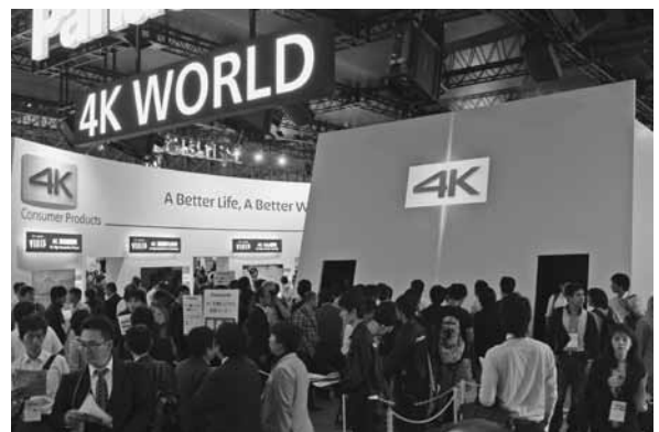
CEATEC JAPAN 2013

また、会場内にはインフラに関するものの展示も多く、中でも注目を集めていたのが電気自動車、プラグインハイブリッド自動車用の充電ステーションだ。これらクルマの普及には、充電ステーションの拡大が欠かせないため、有償のステーション展開に関する提案を行っている企業もあり、課金サービスなどの多彩なサービスを実現するクラウドサービスを提案していた。ネットワークやクラウドサービスなどの通信分野に弱い自動車関連