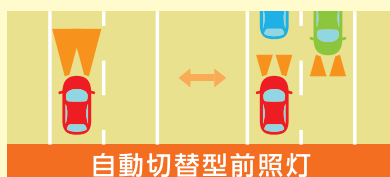
自動切替型前照灯