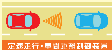
定速走行・車間距離制御装置