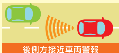
後側方接近車両警報