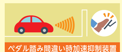
ペダル踏み間違い時加速抑制装置