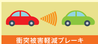
衝突被害軽減ブレーキ

先進安全装備は、あなたの安全運転を支援するシステムです。 機能を正しく理解し、過信せず、安全運転を心がけましょう。